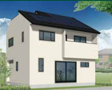
9/7(土)・9/8(日) 盛岡市 中太田会場