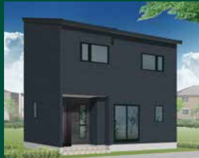
10/19(土)・20(日) 盛岡市 西見前会場

極楽生活!! 5LDK+ロフトの2階建ての家。 ゆったりとした17帖のLDK。 太陽光5.8kW+蓄電池6.5kWh を搭載。全館空調システム 「Z空調」に24時間オート加湿 システム「極楽加湿」を併用。 家全体を一定の湿度に 保ってくれて、人にも、家にも やさしい住宅です。