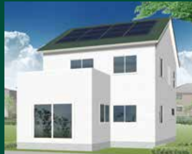
R7.1/11(土)・12(日) 盛岡市 本宮会場

重厚感のある外壁、 片流れの屋根で スタイリッシュな外観に。 床や建具はライトグレージュで 統一し、シックながらも 優しい印象です。 住宅設備やクロスの色合いで アクセントを効かせた シンプルモダンの家。